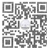
ร่าง พระราชบัญญัติฯ