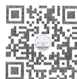
แบบฟอร์มแสดงความคิดเห็น