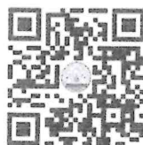
ร่าง พระราชบัญญัติฯ

สำนักกฎหมาย โทร. ๐ ๒๖๕๓ ๔๔๔๔ ต่อ ๑๔๑๕ โทรสาร ๐ ๒๖๕๓ ๔๔๑๑