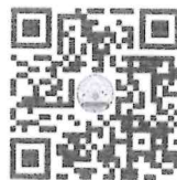
ร่าง พระราชบัญญัติฯ