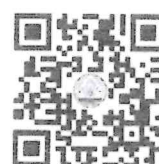
แบบฟอร์มแสดงความคิดเห็น