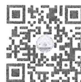
แบบฟอร์มแสดงความคิดเห็น